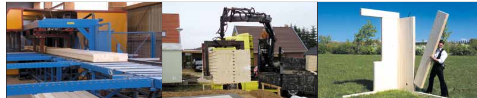
Lepsze wykorzystanie Twojej jednostki obróbczej