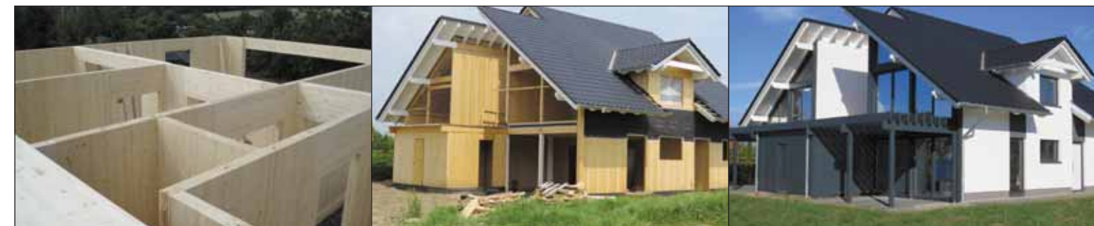
Suche i solidne