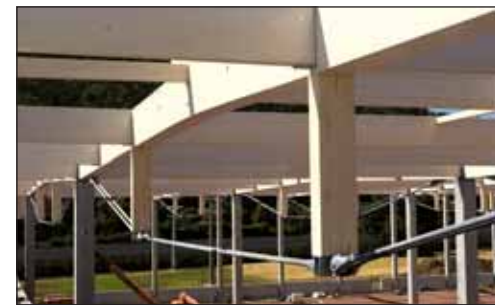
Waldkirch · Wiązary dachowe

Hüttemann Konstrukcje Wielkowieściowe to termin określający wysokiej jakości konstrukcje z drewna klejonego. Duże możliwe do uzyskania rozpiętości, nawet do 56m bez podpór pośrednich, dają olbrzymie możliwości projektowe oraz elastyczność wykorzystania powierzchni. Na życzenie możemy wykonać realizację częściową jak również kompleksową.