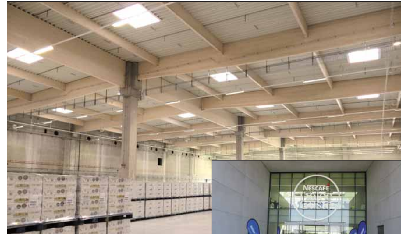
Nestlé Deutschland AG Zakład w m. Schwerin