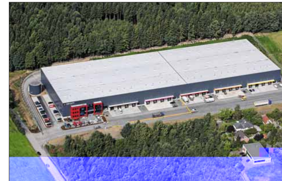
Trilux · Arnberg