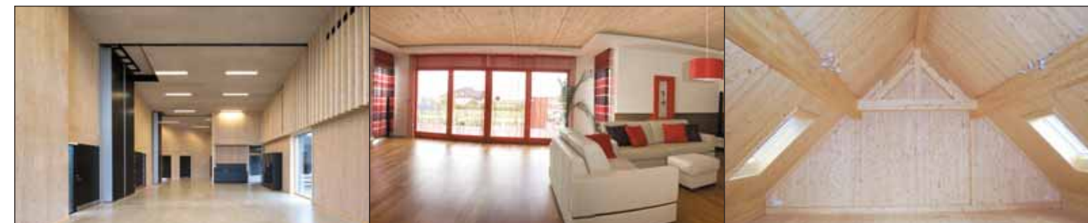
Ściany (HBE - WA)